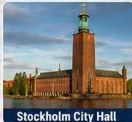
Stockholm City Hall