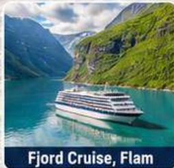
Fjord Cruise, Flam