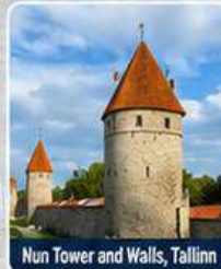
Nun Tower and Walls, Tallinn