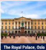
The Royal Palace, Oslo