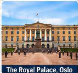
The Royal Palace, Oslo