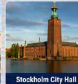
Stockholm City Hall