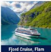
Fjord Cruise, Flam