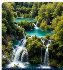
Plitvice National Park