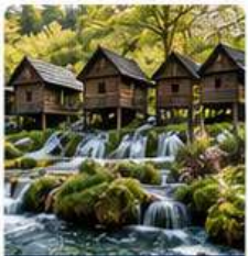
Mlinčići - Watermill's