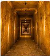
Tunnel Of Hope, Sarajevo