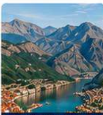
Kotor Old Town