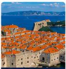
Dubrovnik Old Town