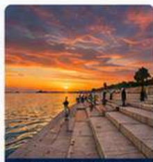
Zadar Sea Organ