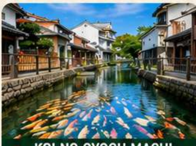
KOI NO OYOGU MACHI STREET SHIMABARA