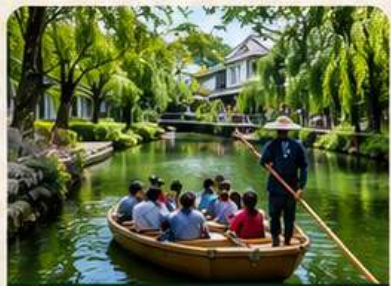
YANAGAWA BOAT RIDE