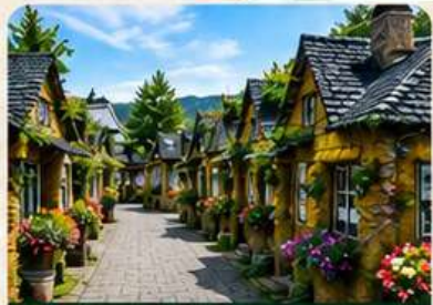
YUFUIN FLORAL VILLAGE