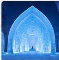
KIRUNA ICE HOTEL