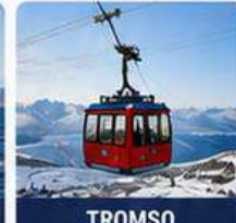
TROMSØ CABLE CAR