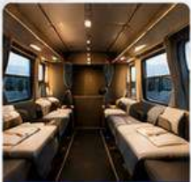
SANTA CLAUSE SLEEPER TRAIN