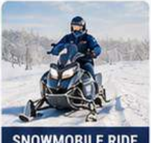
SNOWMOBILE RIDE KIRUNA