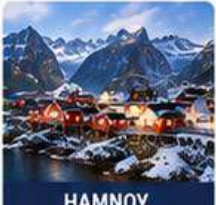
HAMNOY, LOFOTEN ISLANDS