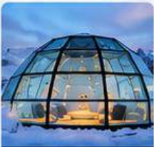
IGLOO HOTEL ROVANIEMI