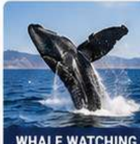
WHALE WATCHING TOUR TROMSØ