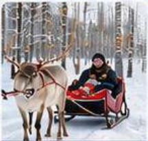
REINDEER SLIDE RIDE