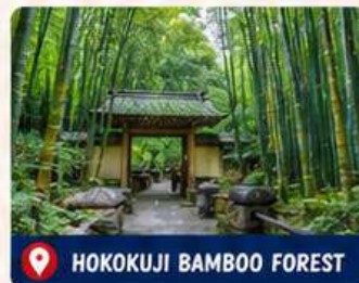
HOKOKUJI BAMBOO FOREST