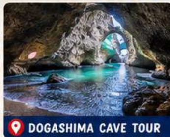
DOGASHIMA CAVE TOUR