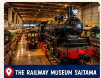
THE RAILWAY MUSEUM SAITAMA