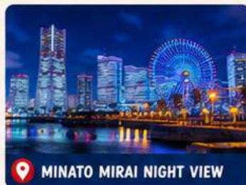
MINATO MIRAI NIGHT VIEW